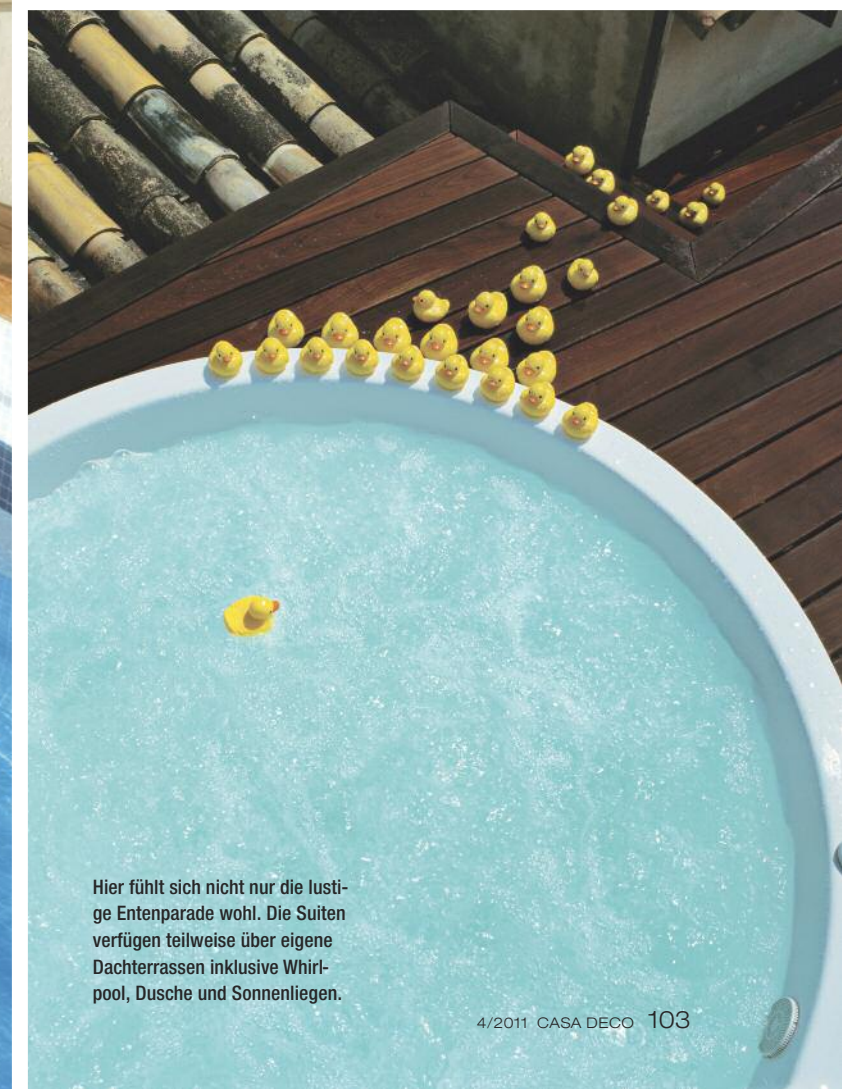
Hier fühlt sich nicht nur die lustige Entenparade wohl. Die Suiten verfügen teilweise über eigene Dachterrassen inklusive Whirlpool, Dusche und Sonnenliegen.